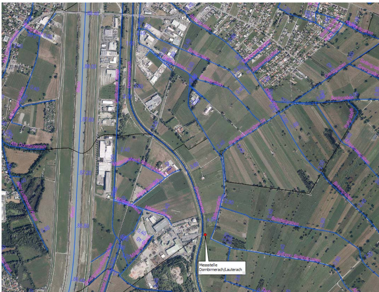
Abb. 1: Messstelle Dornbirnerach / Lauterach, ~FKm 4,1 (Kartengrundlage VOGIS)

Die chemischen Analysen wurden von der akkreditierten Prüfstelle im Umweltbundesamt Wien und die biologischen Wirkttests vom Ökotoxzentrum in der Schweiz im Auftrag des Umweltbundesamtes durchgeführt.